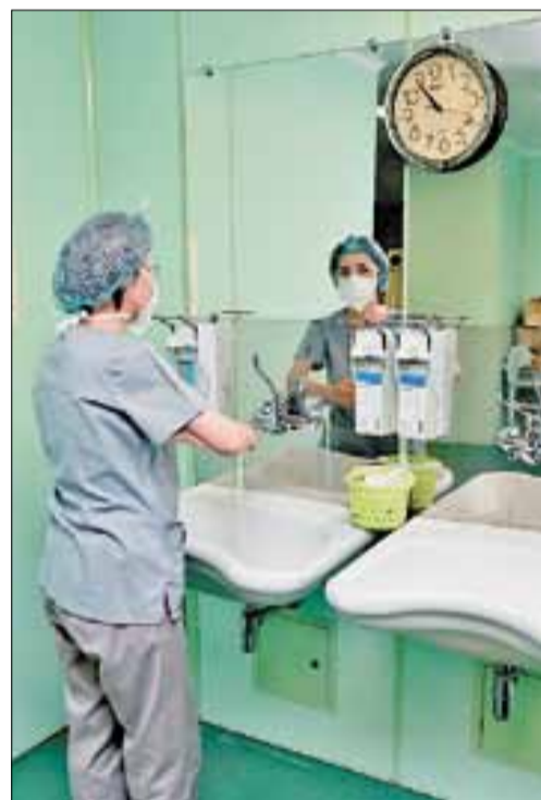
■ Руки должны быть стерильно чистыми