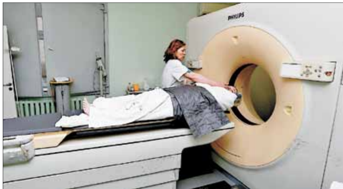
■ Обследование мозга на томографе занимает пару минут

специалистов: неврологи, реабилитологи, массажисты, логопеды, психологи.