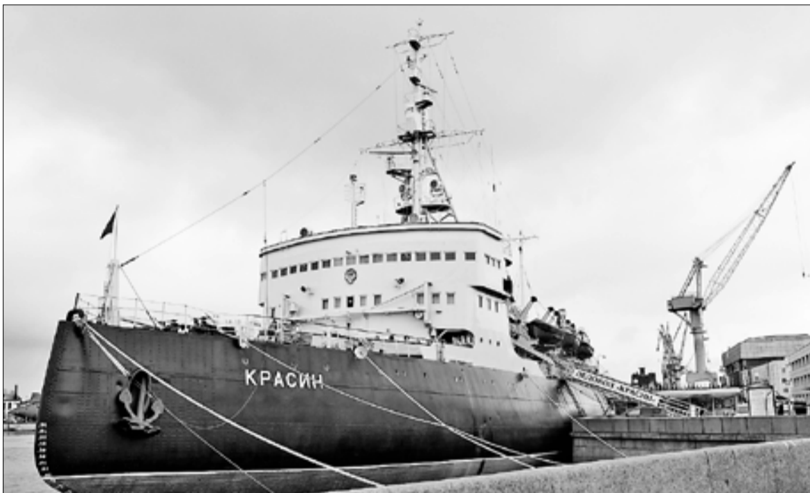
■ В следующем году знаменитый ледокол отметит вековой юбилей

– В 1920 году ледокол принял участие в международной экспедиции по спасению парохода «Соловей Будимирович». Судно в Баренце-