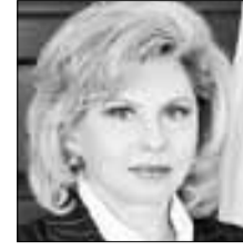
Татьяна МОСКАЛЬКОВА Назначена новым Уполномоченным по правам человека в РФ

«Оценка компетенций учителей должна стать одной из составляющих национальной системы учительского роста. Главная цель – содействовать повышению качества подготовки педагогов российских школ»