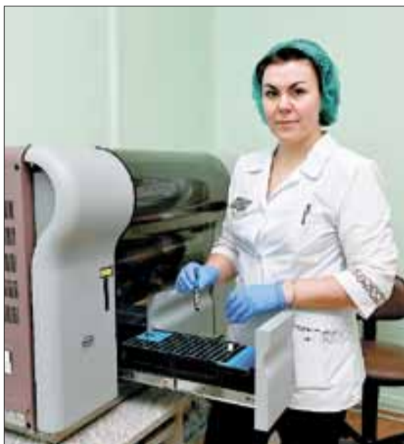
■ В лаборатории современное оборудование