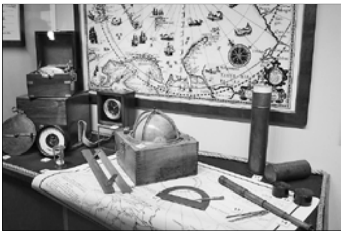
■ Штурманские карты – часть музейной экспозиции