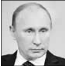
Владимир ПУТИН Президент РФ об импортозамещении

«Мы не должны стремиться к тому, чтобы все импортозаместить. Это неправильный путь, мы должны импортозамещать критические технологии, такие, на базе которых развивается вся экономика, ну и конечно, связанные с оборонной промышленностью. Но все импортозаместить мы не можем, да и не должны, это неправильный путь»