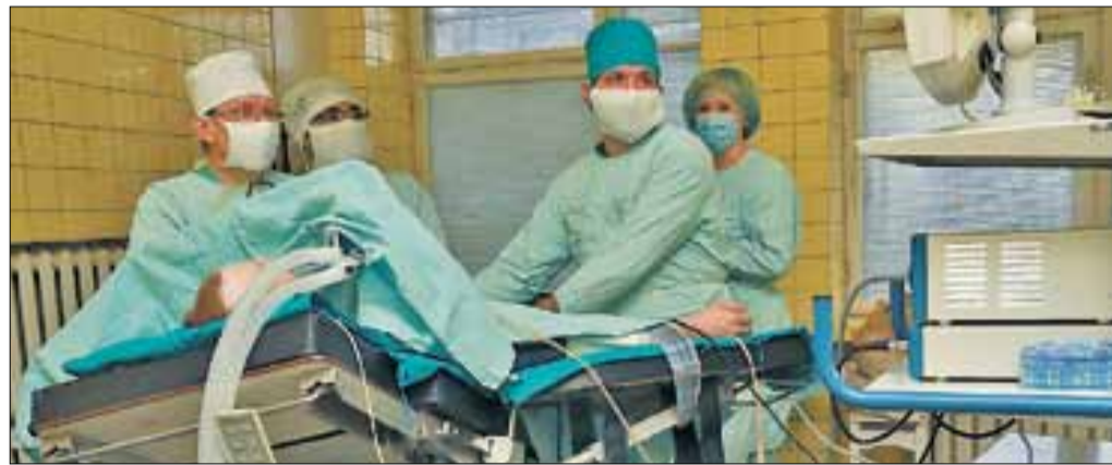
■ Идет срочная эндоскопическая операция