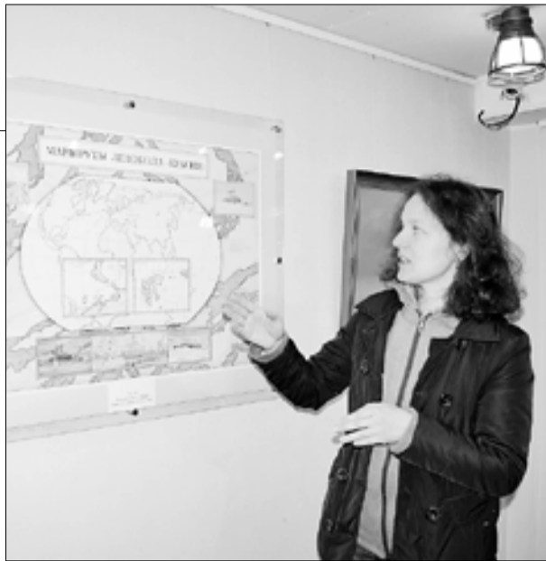
■ «Красин» – единственный в мире ледокол, совершивший кругосветное плавание