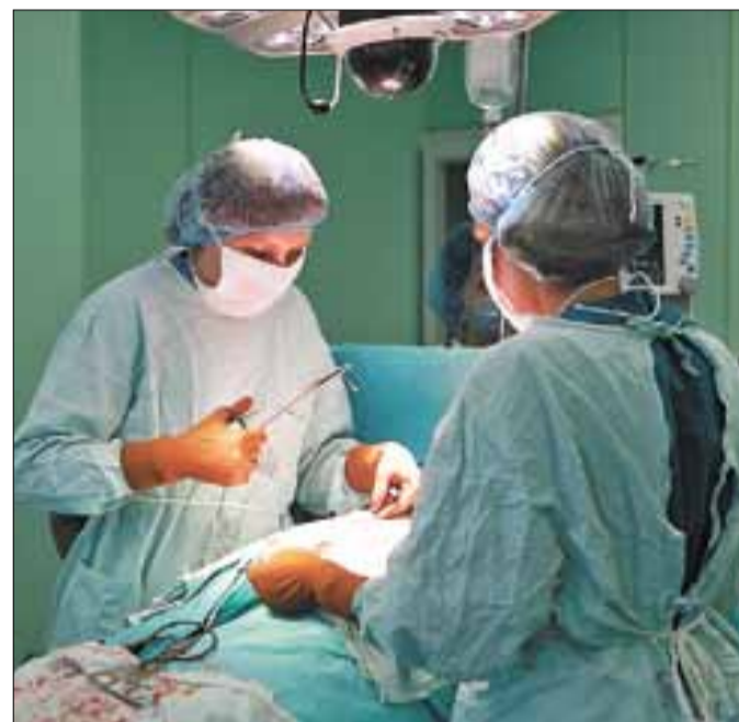
■ Жизнь пациента в надежных руках