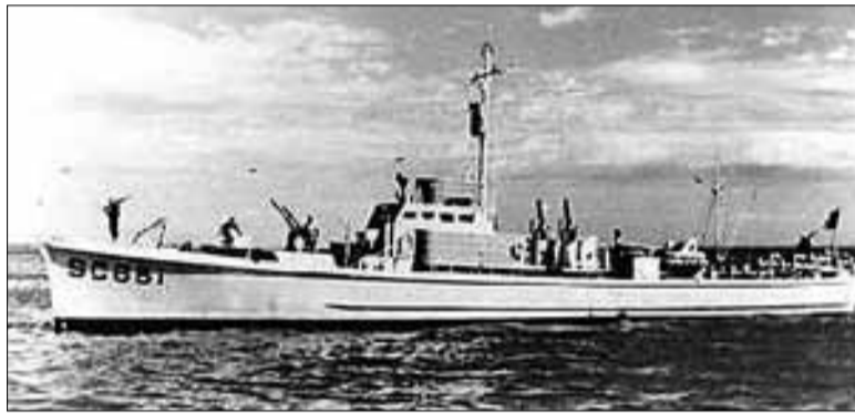
■ Большой охотник типа SC-110

Я родился 24 года спустя. Сейчас я учусь в кадетском классе и знаю, что могу гордиться своим прадедом. Мне очень жаль, что не все его награды сохранились в нашей семье, но то, что осталось, я буду обязательно беречь, как и память о прадеде, проявившем мужество во время Великой Отечественной войны.