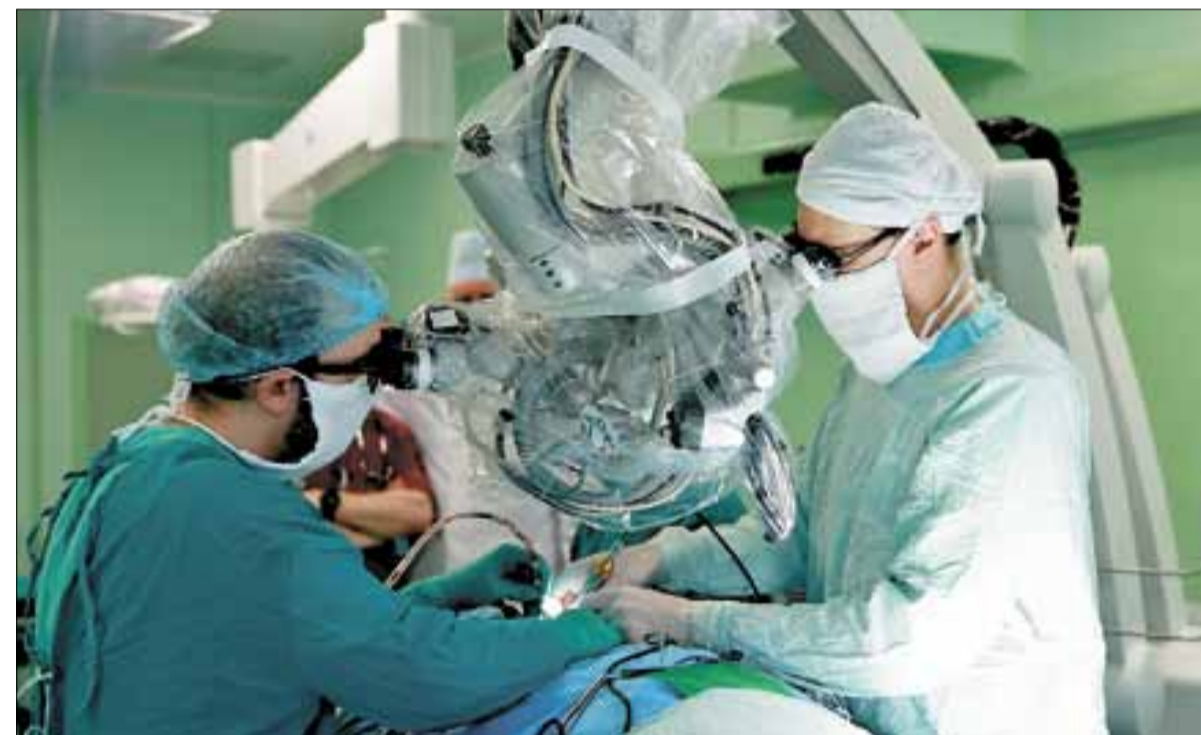
■ В «космических» операционных – «космическое» оборудование